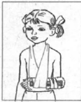
Рис. 3. Шинирование при переломе: а) плечевой кости; б) костей предплечья

больницу, где будет оказана квалифицированная врачебная помощь с последующей реабилитацией больного.